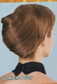
La Roche Posay